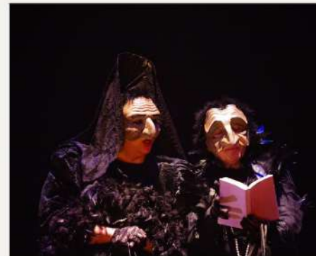
LA MISMA TARA & FACTORÍA ECHEGARAY