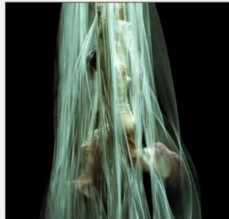
REBE AL REBÉS