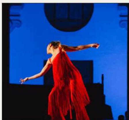
BALLET FLAMENCO DE ANDALUCÍA