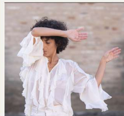
COMPAÑÍA HELENA MARTOS